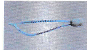
[ หลอดเลือดดำและแดง ]